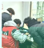
同学们在线下门店实训场景