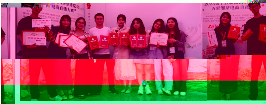
“湖南省第十五届茶博会” 电商直播比赛现场